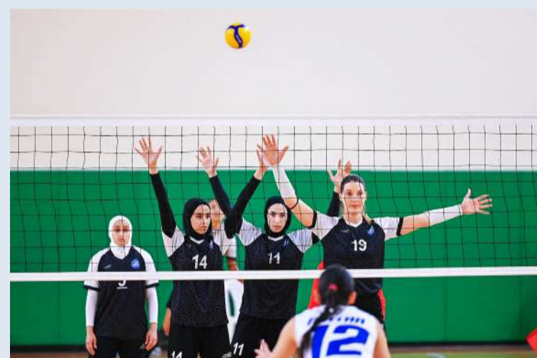
لاعبات فريق سلوى الصباح خلال لقاء سابق بالبطولة

تحتضن صالة نادي خورفكان الإماراتي اليوم، منافسات اليوم الختامي لمسابقة كرة الطائرة بدورة الألعاب العربية للسيدات التي تختتم اليوم بإقامة المباراة النهائية لكرة الطائرة والتي تجمع بين فريقي نادي سلوى الصباح وسبورتنغ المصري، في مواجهة من العيار الثقيل، نسبة للمستويات المميزة والقوية التي قدمها فريقا «سبورتنغ» المصري، و«سلوى الصباح»، سواء في الأدوار التمهيديّة، وربع ونصف النهائي، حيث كانت الترشيدات