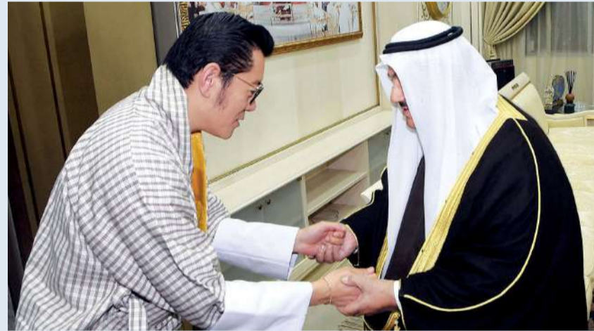
ناصر المحمد مصافحاً ملك بوتان

استقبل سمو الشيخ ناصر المحمد، في قصر الشويخ أمس (الأحد)، ملك بوتان جيغمي كيسار نامجيل وانجشوك والوفد المرافق له، وذلك بمناسبة زيارته للبلاد.