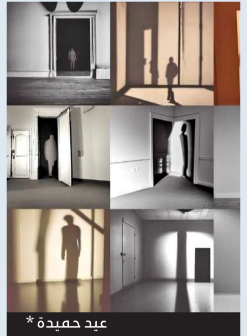
عيد حميدة *

صديق المسافر أين المسير وهل ضاق صدرك وسط الهجير وهل غاب حلمك إن شئت يوماً وحرفك صار سجين الكلام وصمتك أضحى كصمت الأسير وصارت قيودك فوق الشفاه وبين الضلوع وبين الدروب سيصرخ فيك عذاب الضمير لكونك يوماً أرضيت الخنوع قبلت المذلة نمت قريير فكم عشت تجرى وراء السراب وكم بتت بعداً بلا زهير وطاف بعينك سهد طويل يورق جفك حلم قصير ووجه جميل يداعب قلباً به يستجير وينبت عشياً بأرض قفار تمر السنون عليه طويلاً وزاد الحنين لضوء منير لتلمح فيه ظلال خطاك شعاعاً يغير ظلال بنير ويحمل صبحاً جميلاً بنور بهي وشوق كبير وتعدو لتلمح ظل خطاك فكيف النجاة لدرب يسير عواصف شتى وبعيد ويرق فمن يستعيد غباراً يطير وأبى الجناح الذي يحتويك بقلب حنون وصدر نظير فلا ترض يوماً بصمت القبور ولا تطلب الحرف فوق الشفاه فعلاً عليك تظل سجيناً وربك دوماً (حيم) قدير حياة وموت بهذي الحياة فلا أنت حينئذ يربد النجاة ولا أنت للموت صرت تسير وأصبحت تحيا بدون حراك بصمت وجهل وقلب كبير فكم من ملوك طواها التراب وعادوا إلى القبر دون الغدير فقاوم سكوتك وأهزم سجونك كلاهما قيود كلاهما نذير فتأذك لا تخف فيه الحياة فنور الحياة كطير يطير يفتش عن سر هذا الخلود فيفرق بين حياة العبيد وبين الغنى يزيد به جاهها وبين الهوموم بقلب الفقير فلا شيء دوماً سيبقى بقلبك فما دمت ترضى تعيش كذكري وما دمت تحيا كشيء حقير فموتك أفضل من ذي الحياة تعيش طويلاً بغير نصير