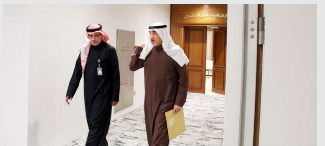
وزير الداخلية بالوكالة خلال الجولة

أكد نائب رئيس مجلس الوزراء وزير الدفاع وزير الداخلية بالوكالة، الشيخ فهد اليوسف، ضرورة اتباع الأسس والإجراءات القانونية الصحيحة في مجال البحث والتحري وضبط القضايا ومراعاة الحقوق والحريات. وقالت الإدارة العامة للعلاقات والإعلام الأمني بوزارة الداخلية، في بيان صحفي، إن وزير الداخلية بالوكالة أكد خلال جولة تفقدية قام بها في الإدارة العامة للمباحث الجنائية «أنه لا احد فوق القانون».