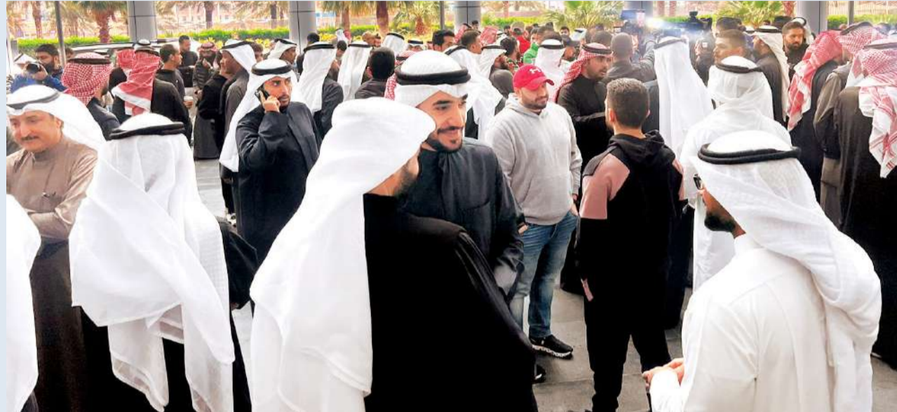
جانب من اعتصام المعلمين

تربويا، أكد المعلمون خلال الاعتصام أن طبيعة عملهم تختلف عن العمل المكتبي ومن ثم لا مبررات