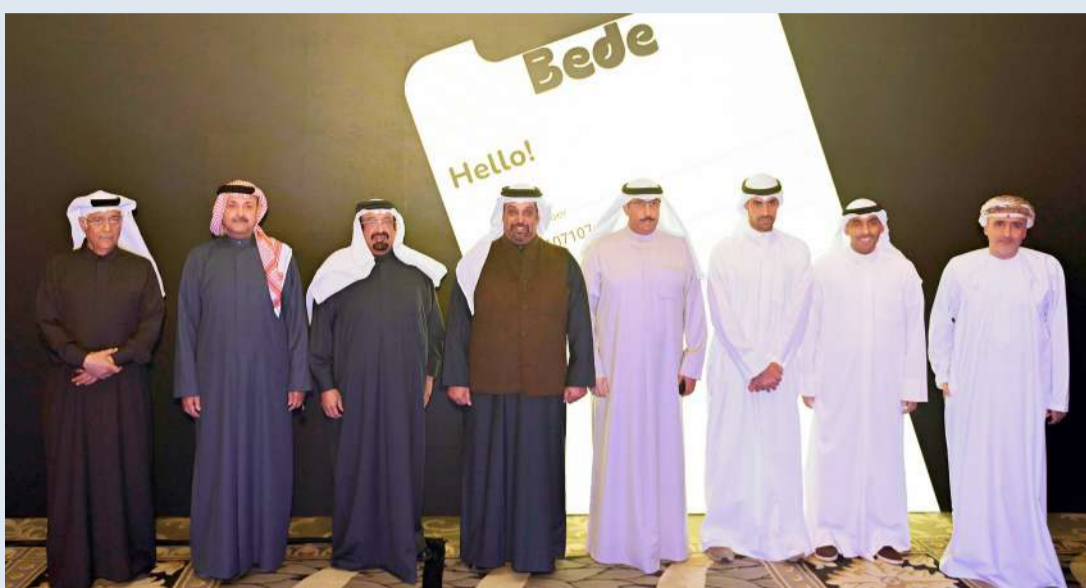
سلمان بن خليفة متوسطاً أسامة الفريح وبدر الخرافي وأحمد بن علي وأعضاء من مجلس إدارة زين وكبار الحضور

جاء إطلاق العلامة التجارية «بيدي» خلال الحفل الذي أقيم في فندق كارلتون البحرين، بحضور وزير المالية والاقتصاد الوطني في مملكة البحرين الشيخ سلمان بن خليفة آل خليفة؛ ورئيس مجلس إدارة مجموعة زين أسامة الفريح، ونائب رئيس مجلس الإدارة والرئيس التنفيذي في مجموعة زين بدر ناصر الخرافي، ورئيس مجلس إدارة شركة زين البحرين الشيخ