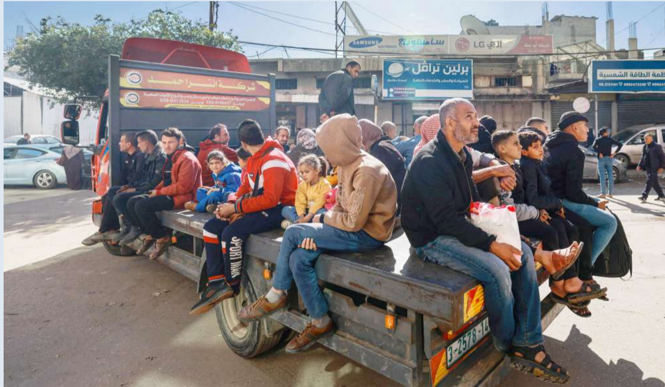
فلسطينيون مستقلين شاحنة صغيرة تنقلهم بمدينة رفح (أ.ف.ب)