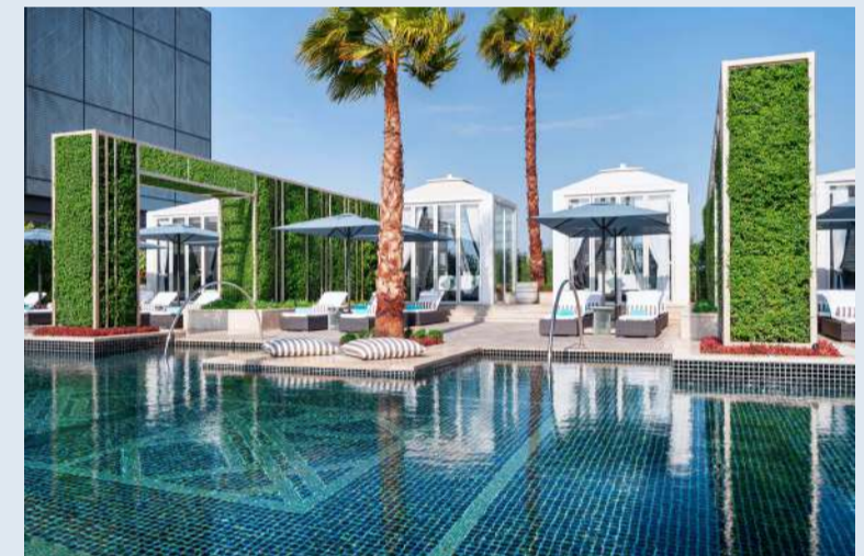
حمام السباحة في الفندق