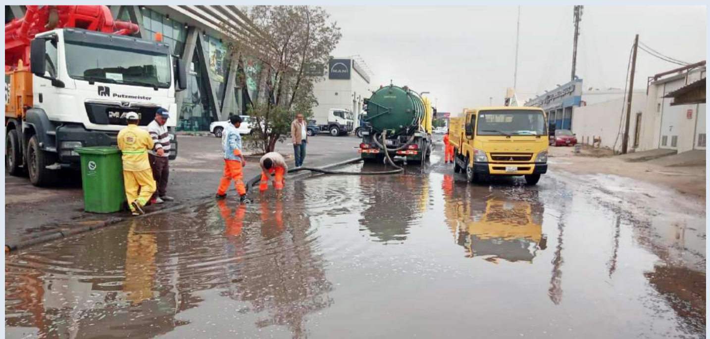
جانب من عمل فرق «الأشغال»

عاشت البلاد أمس يوماً شتوياً كاملاً، حيث تعرضت مختلف مناطق البلاد لموجة من الأمطار متفاوتة الشدة منذ الصباح وحتى وقت متأخر من المساء. واستنشرت أجهزة الدولة المختلفة لوكابة هطول الأمطار على المناطق المختلفة، حيث انطلقت فرق الطوارئ في وزارة الأشغال في جولات تفقدية على مدار الساعة للتواجد في المواقع الحرجة وفي الطرق الداخلية للتعامل مع تجمعات الأمطار وتلبية جميع الشكاوى في هذا الشأن.