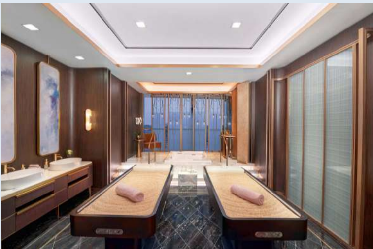
سبا والدورف أستوريا الصحي

كشفت فندق والدورف أستوريا الكويت بكل فخر عن الحدث إنجازاته: «لقد تم تكريمنا بجائزة الخمس نجوم المرموقة من دليل فوربس للسفر عن الفندق. بالإضافة إلى ذلك، حصل منتج والدورف أستوريا الصحي على تصنيف خمس نجوم، مما رفع مكانتنا للانضمام إلى صفوف النخبة في المنتجعات الصحية الأعلى تقيماً في العالم». إن الحصول على هذه الجائزة المزدوجة من فئة الخمس نجوم من دليل فوربس للسفر هو بمنزلة شهادة على الفخامة التي لا مثيل لها، والخدمة الاستثنائية التي يقدمها فندق والدورف أستوريا الكويت. كما يفخر الفندق بكونه الفندق الأول والوحيد من فئة الخمس نجوم في الكويت، الذي يحقق هذا التميز في عامه الأول من التشغيل.