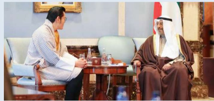
رئيس الوزراء مستقبلاً ملك بوتان

استقبل رئيس مجلس الوزراء سمو الشيخ د. محمد صباح السالم الصباح، في قصر السيف أمس (الأحد)، ملك بوتان جيغمي كيسار نامجيل وانجشوك والوفد المرافق، وذلك بمناسبة زيارته للبلاد. حضر المقابلة وزير شؤون الديوان الأميري الشيخ محمد عبدالله المبارك، والمستشار بالديوان الأميري محمد عبدالله أبو الحسن، ورئيس ديوان رئيس مجلس الوزراء عبدالعزيز الدخيل.