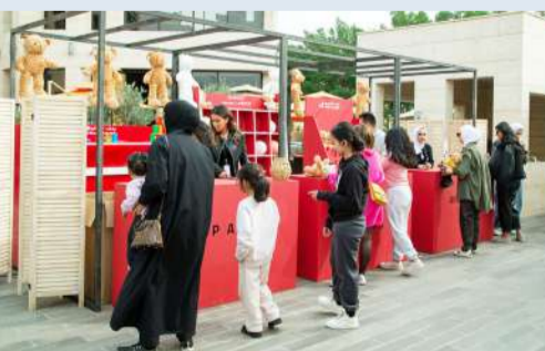
جانب من الفعاليات

وأضاف: «نحرص في بنك الخليج على استكمال دورنا المميز في دعم الشباب من المبادرات وأصحاب المشروعات الصغيرة والمتوسطة، مشيراً إلى أن GB Market وفّر فرصة مثالية للمبارين وأصحاب المشروعات الصغيرة والمتوسطة، ما يتيح لهم تسويق منتجاتهم بشكل مباشر، الأمر الذي يساهم في تطوير تلك المشروعات، ويرفع نسبة مساهمتها في الاقتصاد الوطني بشكل عام».