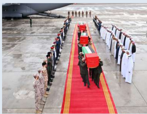
وصول جنّامين الشهداء الإماراتيين إلى مطار الطين في أبوظبي

وأعلنت حركة الشباب المتطرفة مسؤوليتها عن الهجوم من جهتها، أشارت وكالة «صونا» الصومالية الرسمية للأنباء إلى أن الرئيس الصومالي حسن شيخ محمود «بعث تهنئته إلى دولة الإمارات العربية عقب استشهاد ضباط إماراتيين في هجوم إرهابي بالعاصمة مقديشو، داعياً إلى تحقيق فوري في الحادث».