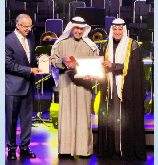
وزير الإعلام مكرمماً الدكتور خليفة الوقيان

والدكتور خليفة الوقيان أحد رواد الشعر الكويتي والخليجي والعربي، وتجربته الثرية امتدت منذ سبعينيات القرن الماضي، والاحتفاء الحالي به هو تقدير وتكريم للوعي المبكر لجيل الرواد الذين أرسوا دعائم الأدب الكويتي، وما زالوا ينشطون في