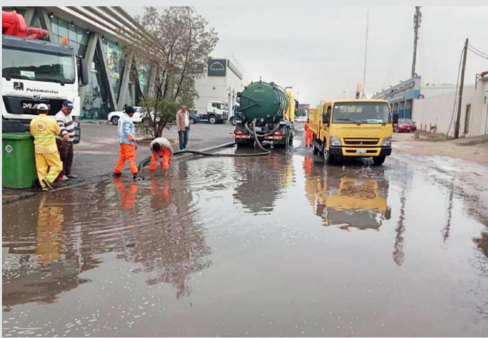
مع الشكاوى المسجلة على الخط الساخن (150) وجرت معالجتها على وجه السرعة». أمنياً، انتشرت الدوريات التابعة لوزارة الداخلية بكثافة وعملت على تنظيم حركة السير، كما تعاملت مع بعض الحوادث المرورية. وأكدت إدارة الأرصاد الجوية أن حالة عدم استقرار الطقس ستستمر حتى فجر اليوم (الإثنين).

وأوضح الصالح أن «هيئة الطرق والنقل البري تعاملت