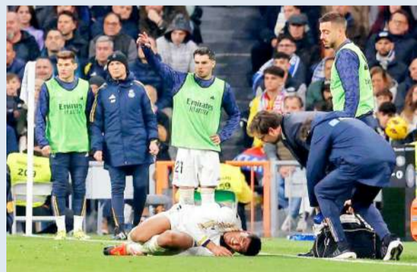
لحظة إصابة بيلنغهام