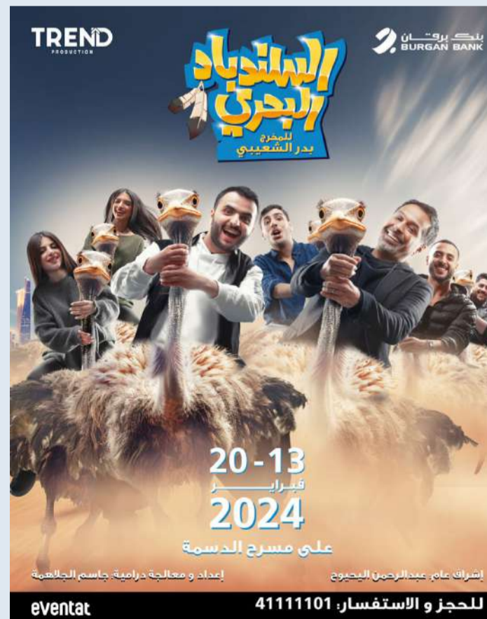
إشراك عام، عبدالرحمن البيحوي إعداد و معالجة درامية جاسم الجلالمه

وإضافة إلى العرض المميّز للمسرحية الذي يستمر لمدة 70 دقيقة، سيتمكن الجمهور أيضاً من الاستمتاع بمجموعة من الأنشطة الممتعة والفعاليات، مثل الرسم على الوجوه، وكشافة التصوير الفوتوغرافي، والعديد من الجوائز التذكارية الخاصة بهذه المسرحية المميزة. وتجدر الإشارة إلى أن مسرحية السنديباد البحري تعتبر ثاني أضخم إنتاج مسرحي لبنك برقان، بالتعاون مع شركة ترند برودكشن.