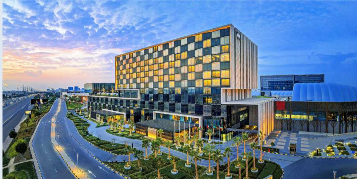
فندق والدورف أستوريا الكويت

من جانبه، أفادت أماندا فريزر، رئيسة قسم التصنيف في دليل فوربس للسفر: «تتضمن قائمة الفائزين لعام 2024 المزيد من الأماكن المميزة، التي يمكن زيارتها في جميع أنحاء الشرق الأوسط وأفريقيا، مع عدد قياسي من الإضافات إلى القائمة في المنطقة. نحن نشيد بجمع الفائزين في عام 2024 لاستمرارهم في تقديم تجربة جديدة للضيوف».