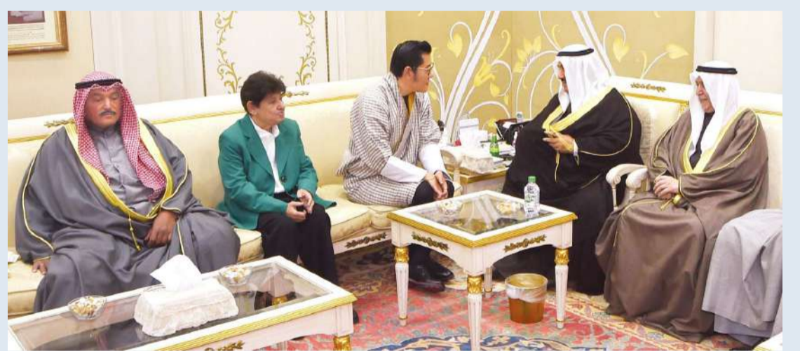
المحمد مستقبلاً ملك بوتان والوفد المرافق

استقبل سمو الشيخ ناصر المحمد، في قصر الشويخ أمس (الأحد)، ملك بوتان جيغمي كيسار نامجيل وانجشوك والوفد المرافق له، وذلك بمناسبة زيارته للبلاد.