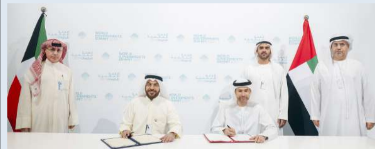
وزير المالية ومحمد الحسيني خلال توقيع الاتفاقية

وقّع وزير المالية وزير الدولة للشؤون الاقتصادية والاستثمار د. أنور المصطفى مع وزير الدولة للشؤون المالية محمد الحسيني الإماراتي اتفاقية تجنب الازدواج الضريبي بين البلدين على هامش مشاركة الكويت في المنتدى الثامن للمالية العامة في الدول العربية الذي عقد في دبي أمس الأحد. وقالت وزارة المالية في بيان إنه بمشاركة المعنيين من صندوق النقد الدولي تم التوقيع النهائي على اتفاقية تجنب الازدواج الضريبي بين الكويت والإمارات في ما يتعلق بالضرائب على الدخل على رأس المال ولمنع التهرب والتجنب الضريبي. وأضافت أن الوزير المصطفى ترأس الجلسة الثالثة من أعمال المنتدى الثامن وبشأن المخارئة القائمة على الميزانية العمومية لخلق القيمة من الأصول العامة كما استعرض تجربة الكويت بهذا الشأن. وذكرت الوزارة أن المصطفى التقى على هامش اجتماعات المنتدى كلا من وزير