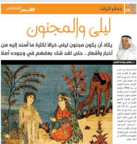
الملحق الثقافي العدد 39 الـ 12 فبراير 2024