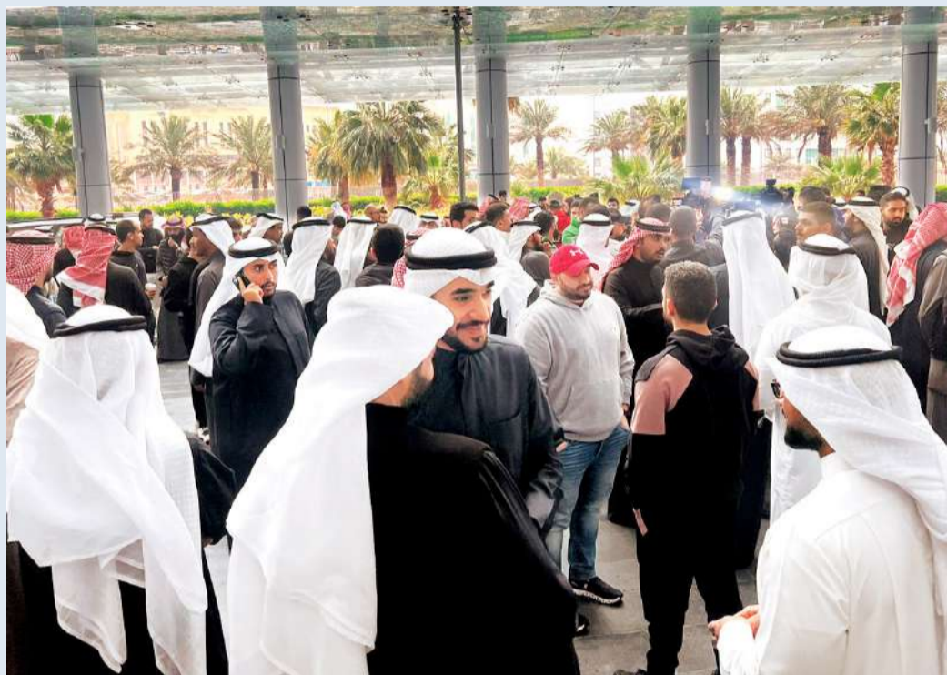
جانب من اعتصام المعلمين أمس