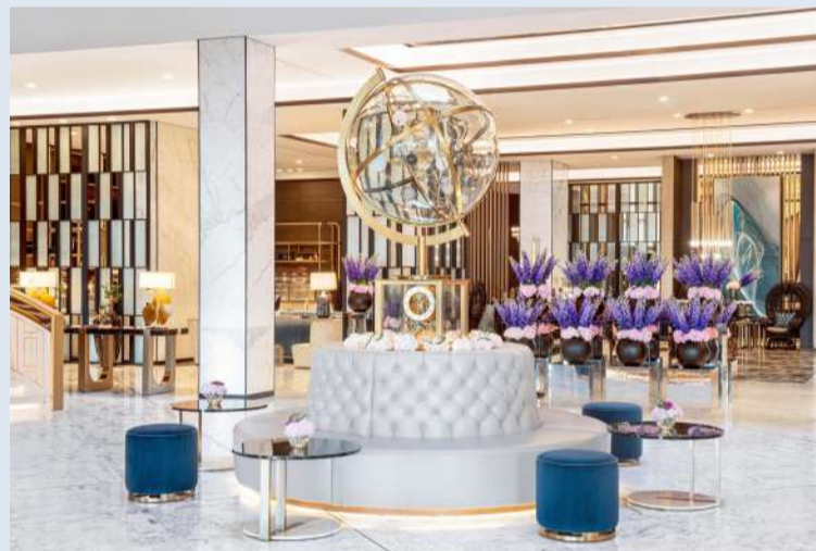
الفخامة والرفاهية في اللوبي