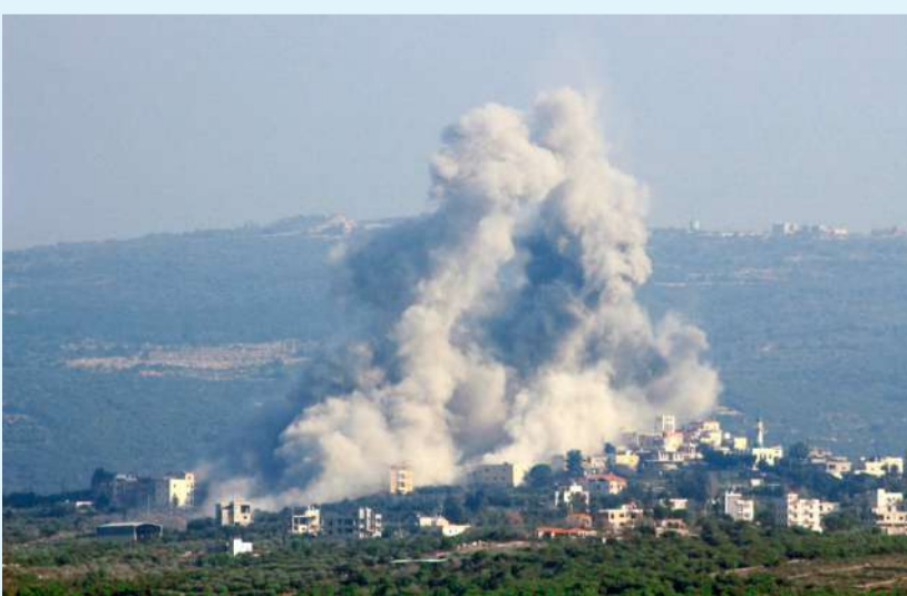
دخان متصاعداً من جراء غارة صهيونية في قرية شحين جنوب لبنان

باسيوك، طرح ضرورة إخراج الفرقة من غزة ونقلها إلى الشمال، لتحل محل قوات الاحتياط لتكون جاهزة لأي سيناريو مع «حزب الله». ولم تتوافر معلومة بشأن توقيت نقل الفرقة التي تتكون من وحدات مناورة «مدرعات، وسلاح المشاة، وسلاح الهندسة»، وتشمل اللواء 188، واللواء السابع، ولواء غولاني،